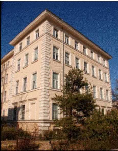
Първа мъжка гимназия

*Благодарим на арх. Елена Маринова Петрова-Генчева и на г-жа Росица Чолакова за любезно предоставените ни архивни материали и снимки (бел. авт.)