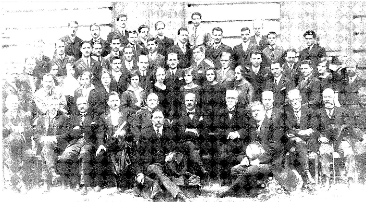
Първият випуск на Медицинския факултет - 1924 г.

През учебната 1947/1948 г. се въвеждат изпитните дисциплини "въведение в медицината" и "философия на естествознанието", които имат за цел насищането на обучението по медицина с елементи на марксистко-ле-