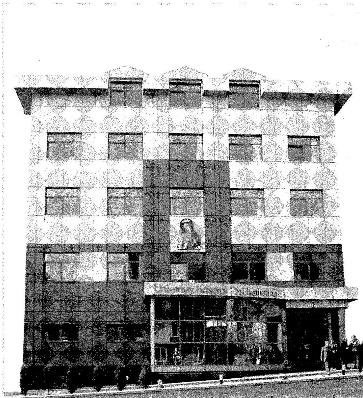
Университетска болница "Св. Екатерина"

Разформирането на мегаломанската Медицинска академия и номинативното възстановяване на Софийския медицински факултет се оказват негостатъчни за възвръщане на първоначалното му достойнство на национална институция, управлявана по законите на академичната автономия. Не е нужна особена прозорливост, за да се види, че периодът на най-интензивно изграждане и на най-плотворна работа на факултета е този между 1926 и 1950 година, в условия на спокойствие и уравновесени интереси (лични и обществени). Репалната академична автономия на Медицинския факултет се основава на това, че като всяка друга гържавна научно-учебна институция, факултетът през този период е погледомствен на Министерството на просвещението. Двата периода (до 1926 и след 1950 г. и досега), през които Медицинският факултет е пог факти-